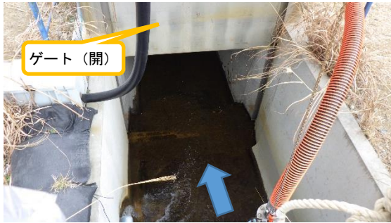
(写真2) 物揚場排水路ゲートの状況 (西側(上流側)から撮影)