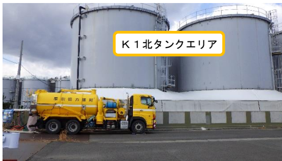
(写真3) K1北タンクエリア内堰内の回収水の 移送作業の状況(東側から撮影)