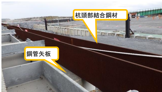
(写真2) 杭頭部結合鋼材の設置状況