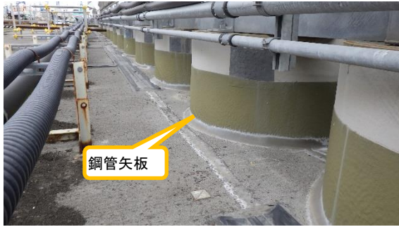
(写真1) 海側遮水壁の鋼管矢板設置状況 (1号機タービン建屋東側付近)