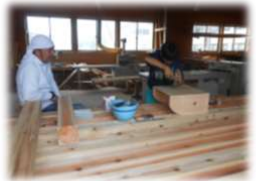
中学生の職場体験のようす 大桃建設工業さん