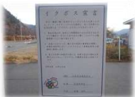
「イクボス宣言」山星建設さん