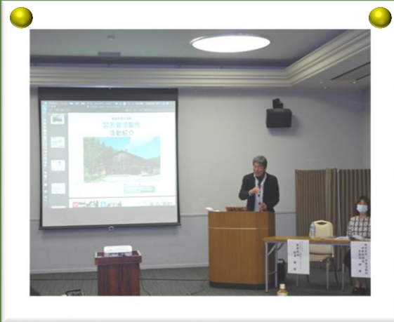
芳賀沼代表取締役による講演の様子