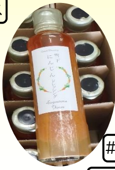
#にんじンドレッシング #白河ブルーベリーヒル