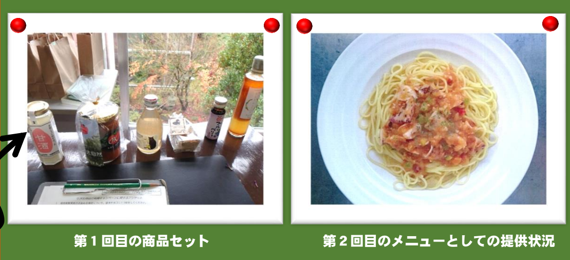
第1回目の商品セット