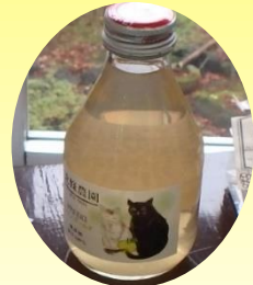
#りんごジュース #北條農園