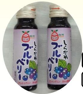
#ブルーベリードリンク #白河ブルーベリーヒル