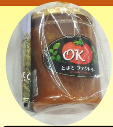
#トマトソース #岡崎農園