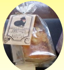
#りんごケーキ #北條農園