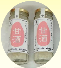
#甘酒 #山口こうじ店