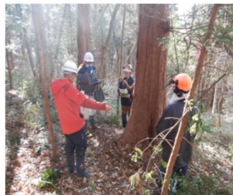
安全パトロールの様子