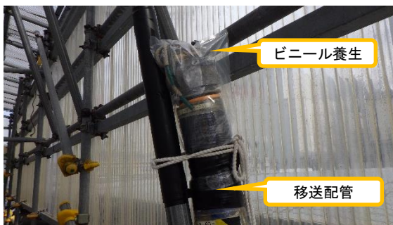
(写真 2) 撤去予定の移送配管末端部の ビニール養生の状況