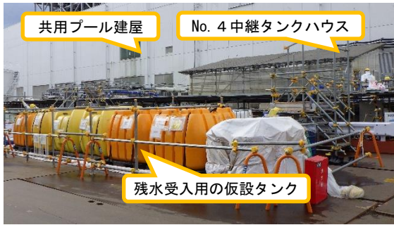
(写真 1 - 1) No. 4 中継タンク周辺の状況 (東側から撮影)