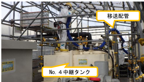
(写真 1 - 2) No. 4 中継タンクハウス内での 移送配管撤去作業の状況 (南側から撮影)