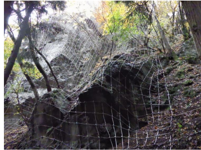
下郷町小沼崎地内