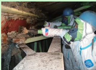
吹付け石綿の除去作業の様子