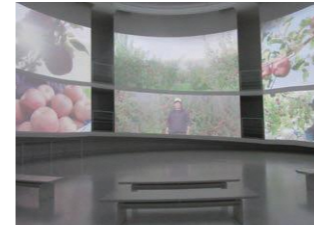
7面巨大スクリーン