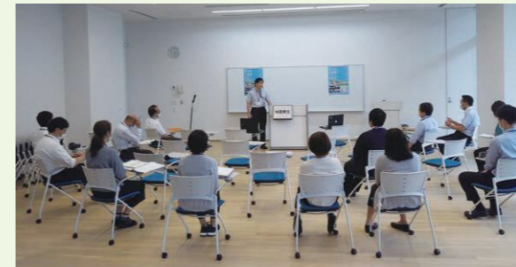
語り部講話(イメージ)

その他、被災地を訪れ、被災した施設や復興の状況を見て学ぶフィールドワークのツアーも、団体向け研修プログラムとして実施します。