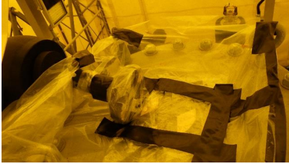
(写真1-1) 吸着塔上部の状況 配管が取り外されており、復旧されて いなかった