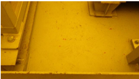
(写真2) 漏えいパン内の状況