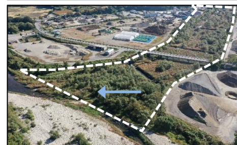
加藤谷川（南会津町）