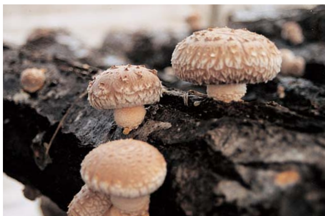
原木しいたけ（霊山町）