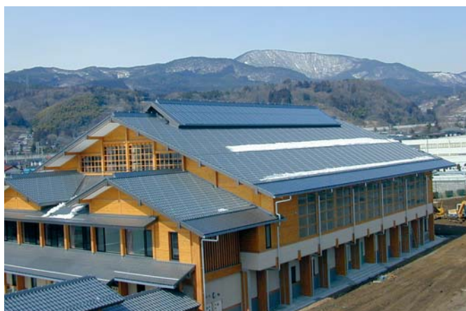
県産木材を多用した桑折町地域交流センター（桑折町）