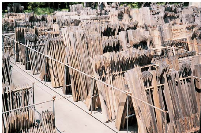
三島桐加工場の桐材の洗抜き(三島町)