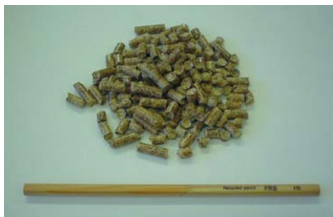
上：ペレットストーブ 下：ペレット（棒は鉛筆）