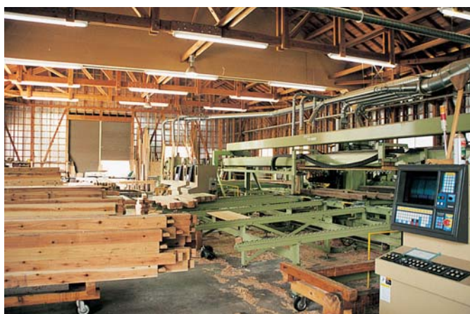
㈱エイサップのプレカット工場（磐梯町）

プレカットや集成材加工等のように、一度製材した木材をさらに加工し、より高度な製品をつくる施設。