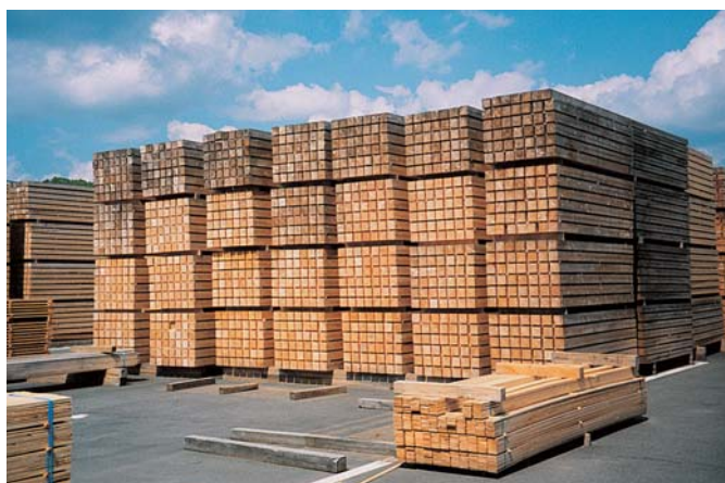
田村地方森林組合(ウッドミル田村)の製材品(常葉町)