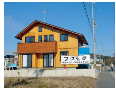
福島県木造技術開発協同組合（フクモク）の木材をふんだんに使った住宅の開発（郡山市）

*《ふくしま県産木材利用推進会議》 地産地消の理念に基づき、公共事業等における県産木材の利用促進を図るための推進組織で、知事部局7部2局及び教育庁、警察本部で構成されている。