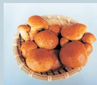
福島N2号（林業研究センター）

消費者の視点から育種した菌種で、多様な料理法に適する傘が大型で柄が太いなめこ品種。