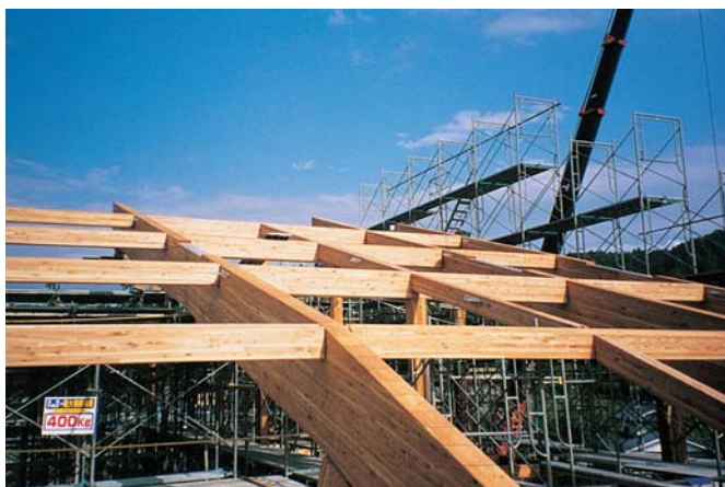
集成材を利用した霊山町地域交流センターの建設（霊山町）