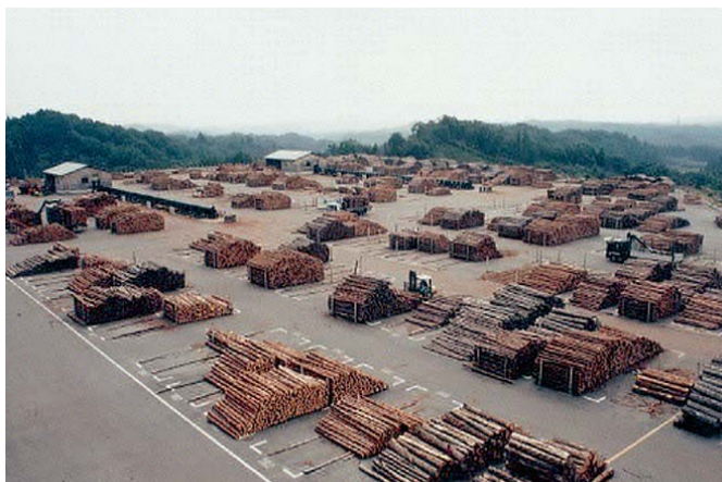
いわき木材流通センター（いわき市）

※《福島県特用林産振興基本計画》 特用林産物を本県の農山村地域の活性化を担う重要な産業として位置づけ、地域の実情に応じた特用林産物の生産・流通・販売についての対策を総合的に推進するために、平成10年度（平成13年度改正）に県が策定した。