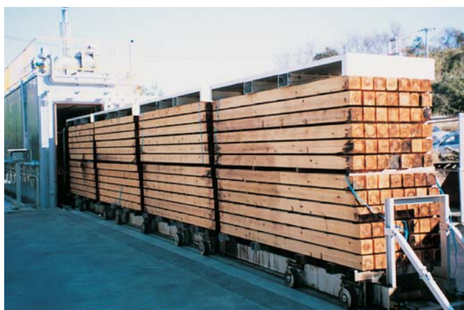
磯いわき木材加工センターの木材乾燥施設(いわき市)

福島県産ブランド材の愛称で、ブランド材認証工場で、JAS規格より厳しい基準(含水率20%以下等)に基づいて生産された住宅資材用福島県産乾燥木材のこと。