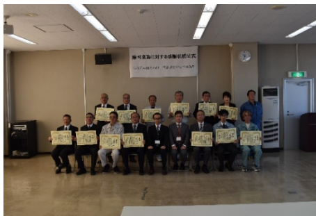
令和元年度 贈呈式の様子