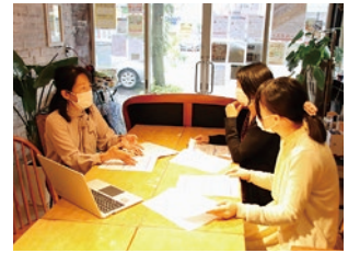
福島市置賜町 5-4 ☎024 (572) 5644 ※セミナーなどの情報はWEBサイトをご覧ください。 https://www.collabococo.com