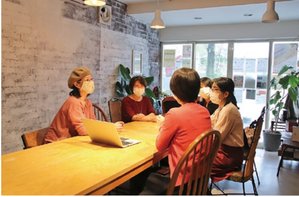
仲間との出会いが、新たな取り組みにつながることも