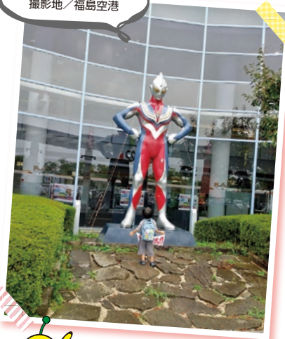
金澤 麻里さん 撮影地 / 福島空港