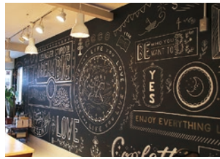
道を切り開く女性へのメッセージが込められたチョークアート

福島駅前の中心街にあるレンタルスペース。働く女性や子育て中のお母さんを対象に、多彩なセミナーや交流会を開催しています。周囲とのより良い関わり方を学び、コミュニケーション能力の向上やスキルアップを目指す「コーチング講座」も定期的に開催中。