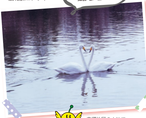
藤井 利一さん 撮影地 / 白河市