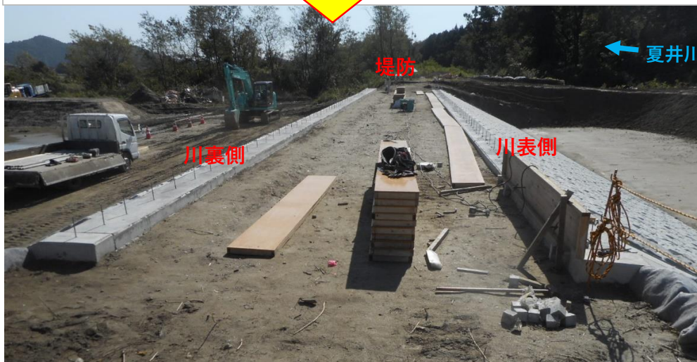
天端舗装施工状況