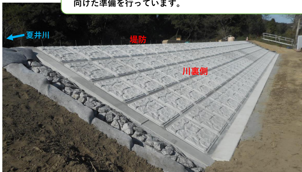
川裏側 コンクリート張ブロック完了 (10月末)