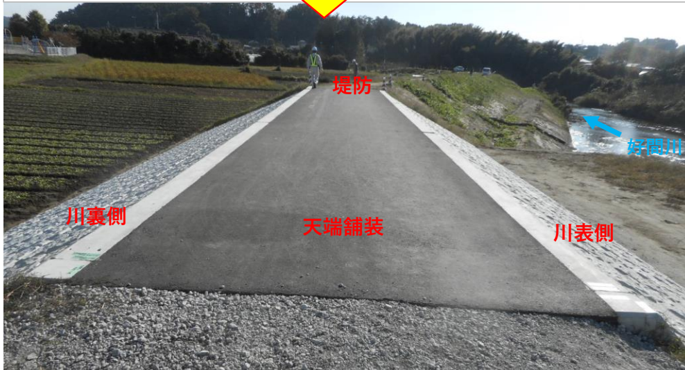
天端舗装完了 (8月末)