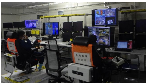
(写真1) 遠隔操作室での重機の操作状況