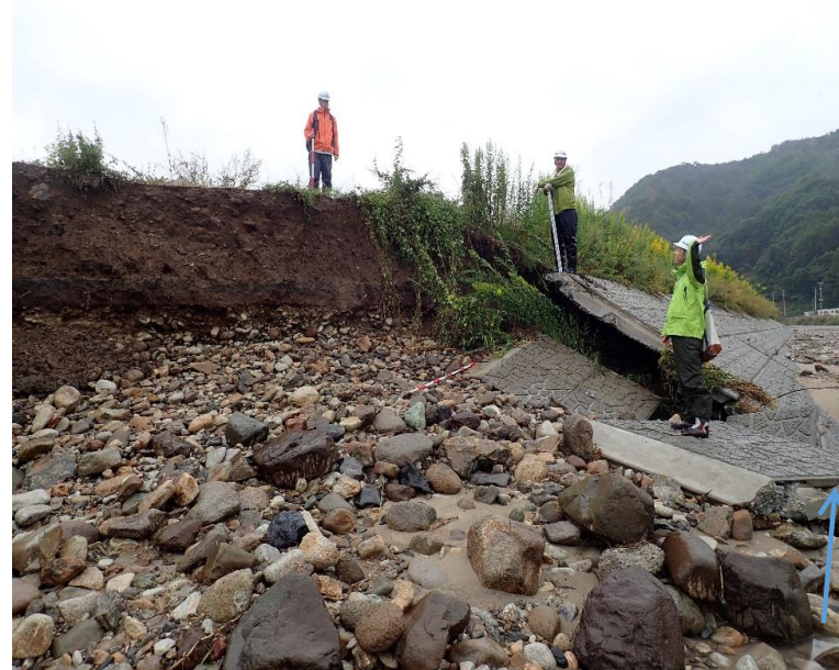
被災状況（令和元年10月15日撮影）