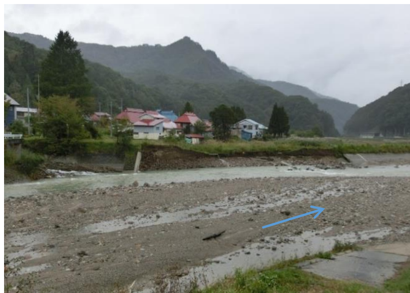
被災状況（令和元年10月15日撮影）