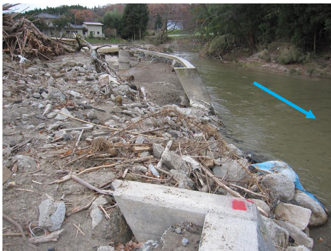
被災状況：移川（二本松市）