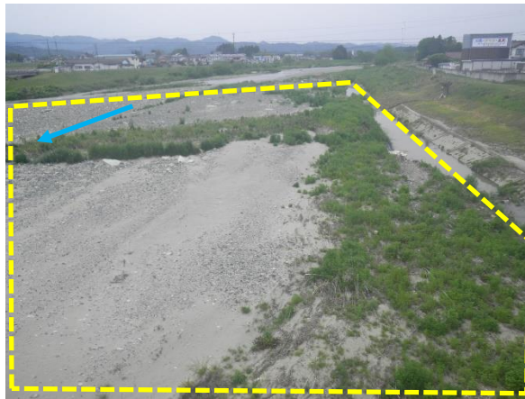
河川を阻害する堆積土砂

【補正の内容】 河川断面を阻害する堆積土砂の撤去（浚渫）や樹木の伐採を実施します。