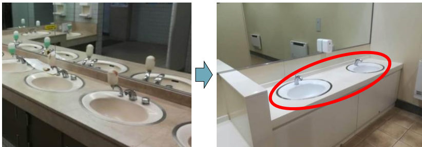
手洗い自動水洗化イメージ