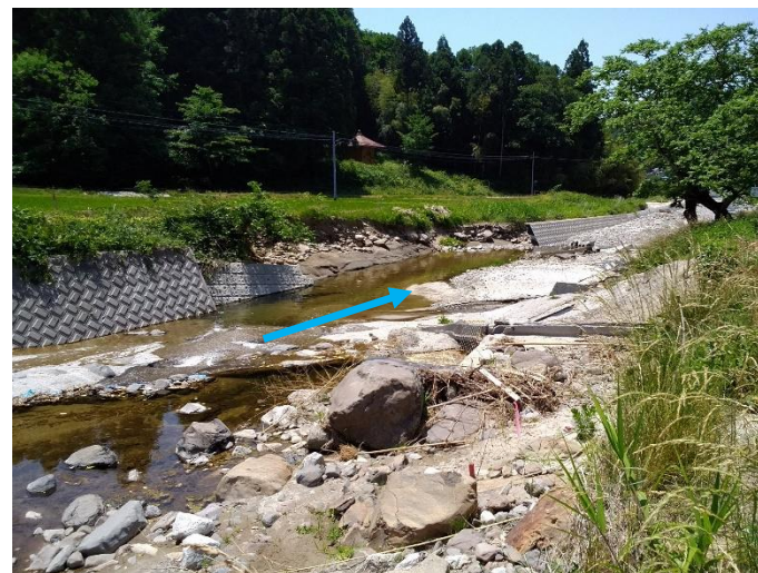
被災状況：山舟生川（伊達市）