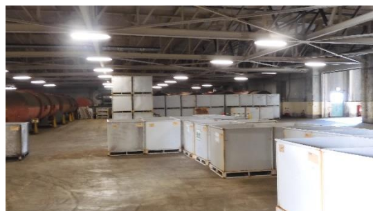
(写真 3 - 2) 使用済保護衣等の一時保管状況