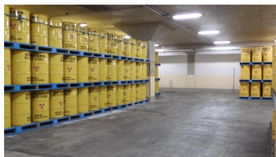
(写真 4 - 2) 焼却灰等の保管状況