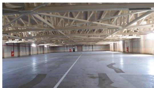
(写真 2 - 2) 廃棄物の保管はなかった。