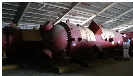
(写真 1 - 2) 給水加熱器の保管状況