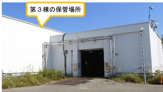
(写真 3 - 1) 第 3 棟の状況 (入口付近)