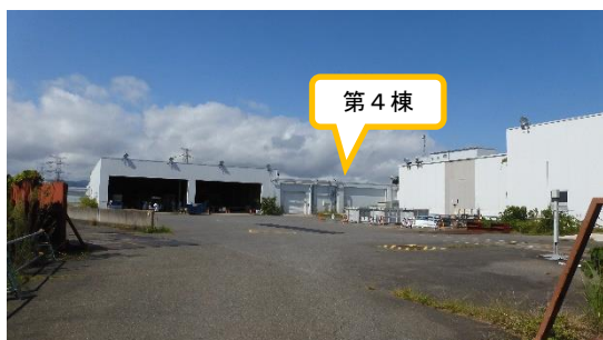
(写真 4 - 1) 第 4 棟の状況