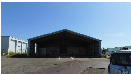
(写真 1 - 1) 第 1 棟の状況 (西側から撮影)