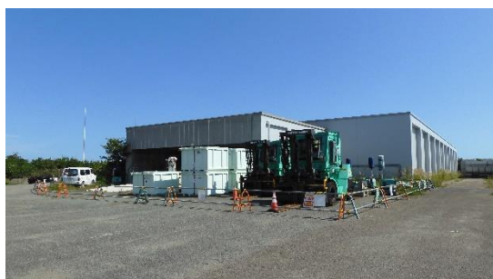
(写真 2 - 1) 第 2 棟の状況 (第 1 棟の北隣)