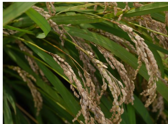
写真2 穂いもち（穂首いもち）の発生の様子