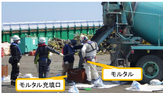
(写真1-2) メガフロートへのモルタル充填作業 の状況