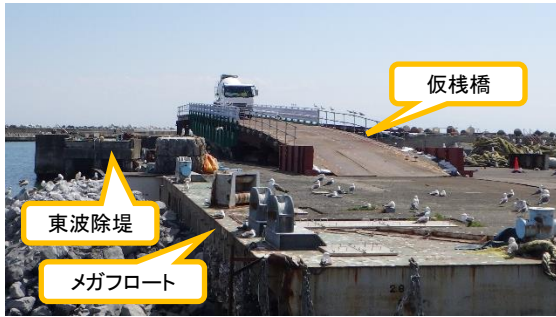
(写真1-1) 仮棧橋を渡っているミキサー車