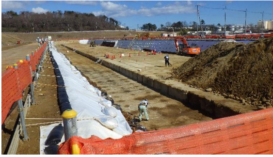
(写真1) 南西側から撮影