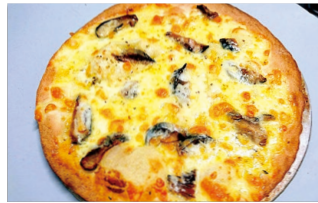
パリパリのうす生地にニシン&チーズの濃厚な味わいが魅力!

築100年以上の古民家を改装したイタリアンレストラン。季節の素材を使ったパスタやピザが豊富で、サラダや前菜、デザートが付いたお得なランチセットもあります。会津の郷土料理「ニシンの山椒漬け」を使ったピザなど、オリジナルのメニューも楽しめます。