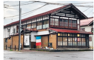
耶麻郡西会津町野沢原町乙 2211-1 ☎0241(45)2204 定休日/水曜 営業時間/午前11時~午後2時30分(ラストオーダー午後2時)、 午後5時~午後8時30分(ラストオーダー午後7時30分)