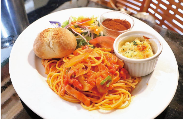
ランチタイム限定的パスタプレートもおすすめ