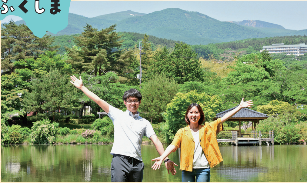
安達太良山が見える鏡ヶ池公園からの眺めが、お二人のおすすめスポット