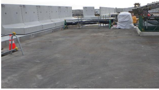
(写真1-4) 4号機タービン建屋北東側の状況