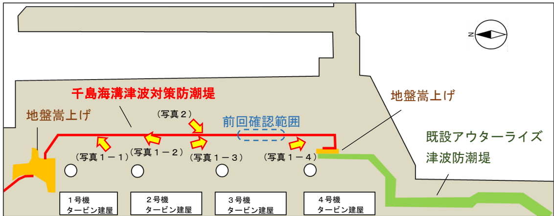
(図2) 千島海溝津波対策防潮堤詳細図