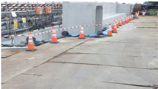
(写真1-3) 3号機タービン建屋北東側の状況