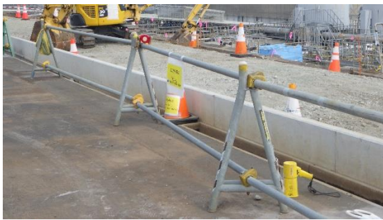
(写真1-1) 1号機タービン建屋東側の状況