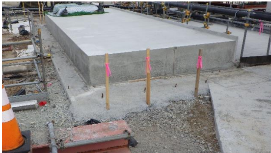
(写真1-2) 2号機タービン建屋東側の状況