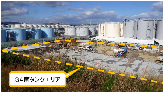
(写真1-1) G4南タンクエリア全景