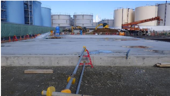
(写真1-3) 新たに構築されたタンク基礎