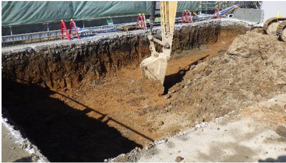
(写真1-2) タンク基礎構築のため地盤改良中の 箇所