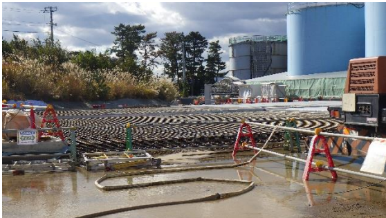
(写真1-4) 構築中のタンク基礎