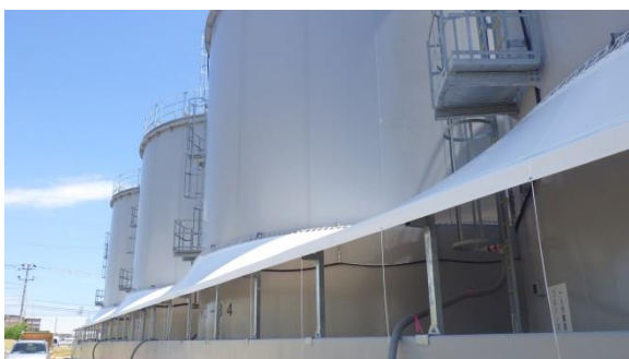
(写真1-2) H3タンクエリア南西側から 撮影