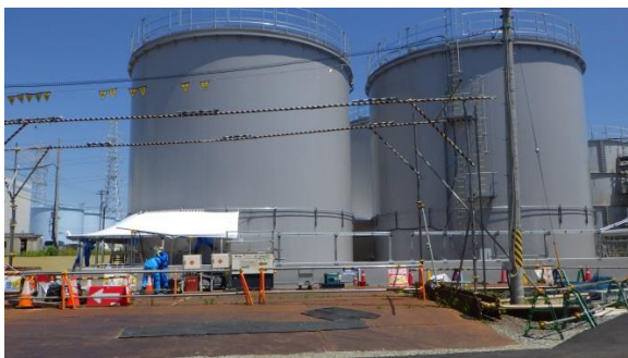
(写真1-1) H3タンクエリア南側から 撮影