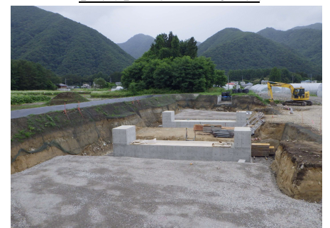
【写真2】酒ノ沢治山水路工事状況