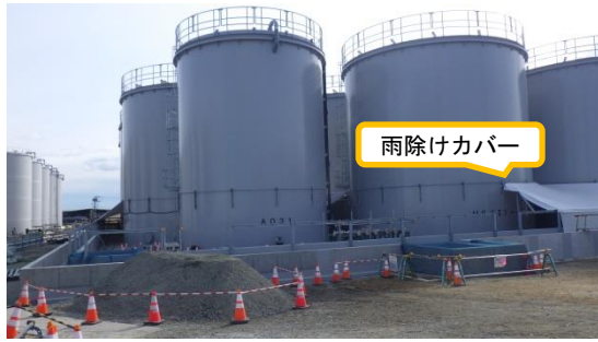
(写真 1 - 1) 前回撮影 (平成31年 1 月31日)