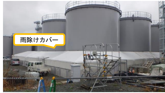
(写真 1 - 2) 今回撮影 (平成31年 4 月11日)