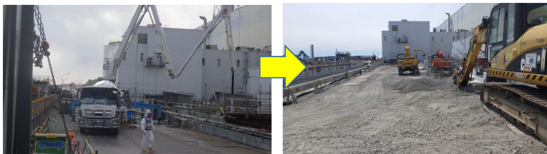
（写真1－1）逆洗弁ピット覆工の状況①（北側から撮影） （前回撮影） （今回撮影）