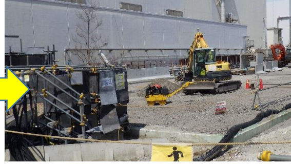
(写真1-2) 逆洗弁ピット覆工の状況② (南東側から撮影) (前回撮影) (今回撮影)