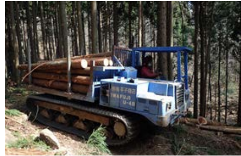
■ 間伐材搬出の支援