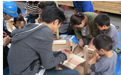
■ 木とのふれあい創出