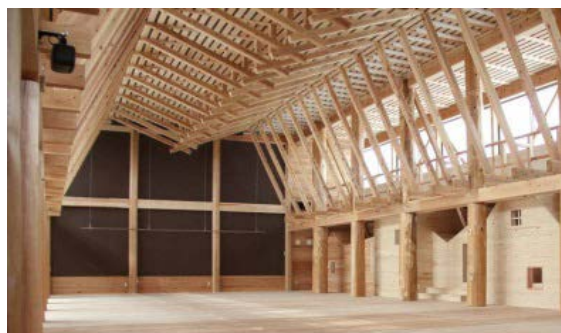
■ 県産材の利活用推進（地域提案重点枠）