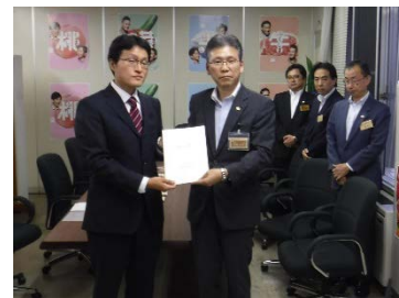
■ 森林づくりの提言

さらに、令和2年3月27日には、森林環境税について、現在の7つの施策展開の継続、拡充により制度を継続すべきとする「森林環境税を活用した取組に対する意見」を取りまとめた。