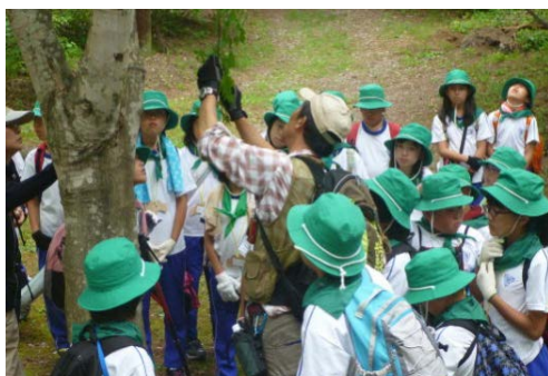
■ 森林環境学習を支援（森林環境基本枠）

【実績】県内の 666 校（全体の 72%）の小中学校で森林環境学習を実施。集落周辺や街道沿線の森林の整備など、地域の課題に対応した森林整備の実施のほか、図書館や公民館等の市町村有施設や、小中学校や幼稚園等の保育施設において、県産材を使った