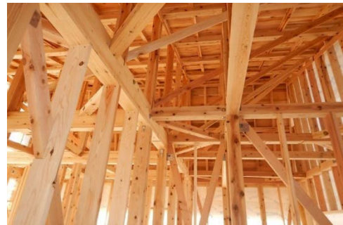
■ ポイント交付住宅