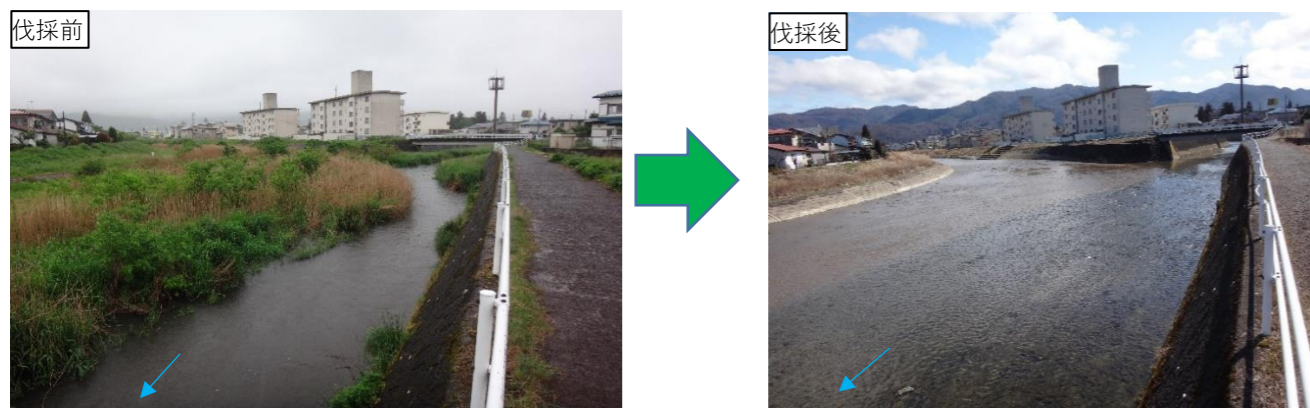
土砂掘削・伐採 イメージ

○当初、当事業について説明会を開催する予定でしたが、昨今の「新型コロナウイルス」の影響により、当面の対応としまして文書での回覧となりましたのでご理解をお願いします。