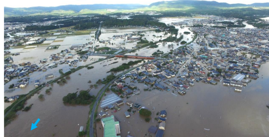
令和元年10月13日の夏井川の様子

○二級河川夏井川水系夏井川は、小野町を上流端としていわき市を流下し、太平洋に注ぎます。県管理区間河川延長が67.1km、流域面積748.6km 2 と福島県で管理している二級河川で一番大きな河川です。