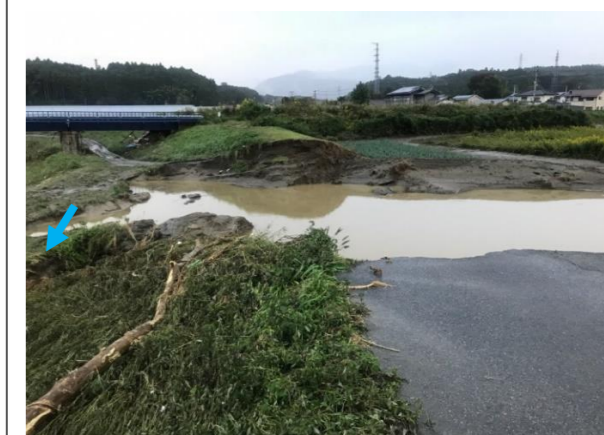
令和元年東日本台風により破堤した 好間町今新田の様子