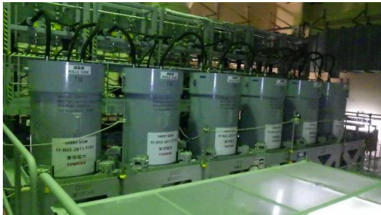
(写真1) 左側2塔：ろ過フィルタ 右側4塔：吸着塔