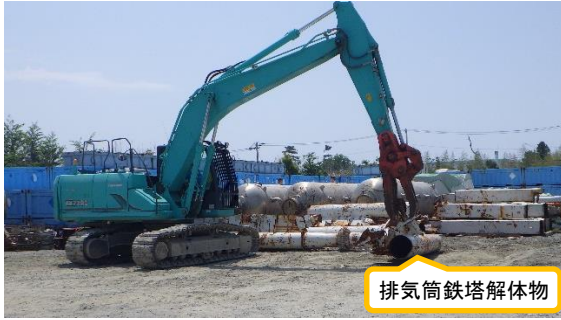
(写真1-1) ガレキ類一時保管エリアP1 (エリア南西側)