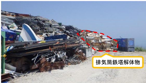
(写真1-2) ガレキ類一時保管エリアP1 (エリア北東側)