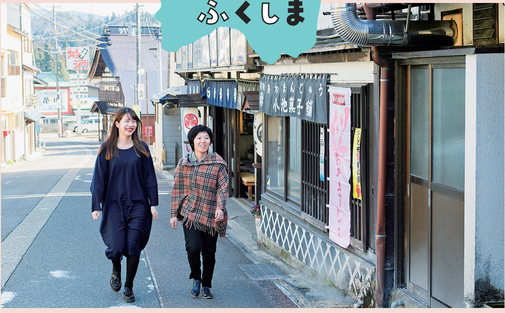
商店街の人たちと一緒にプランを練ることもあります。