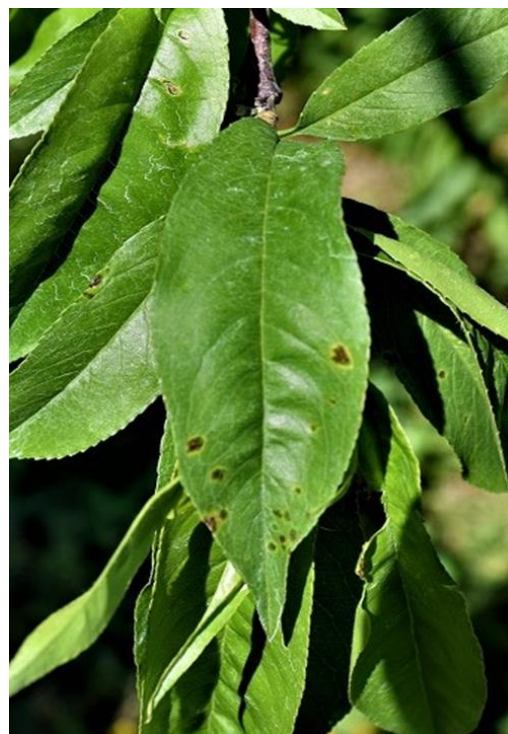
図3 新梢葉での発病