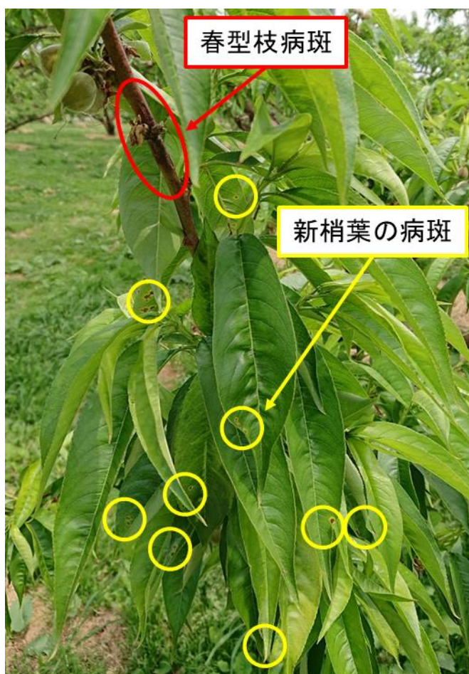
図2 春型枝病斑の周囲での集団的な発病