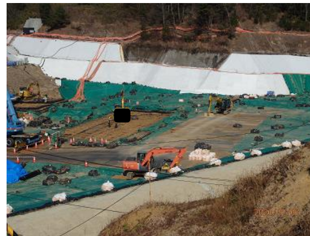
下流側埋立地の埋立状況の確認