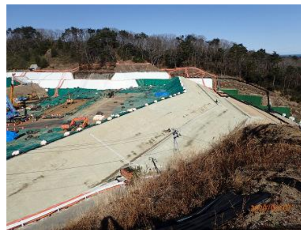
土堰堤の状況確認