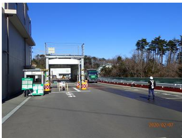
輸送車輛の状況確認