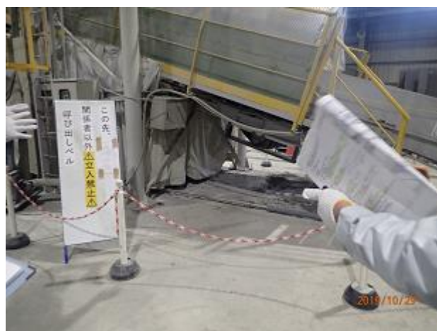
受入・分別施設における事故発生状況の確認