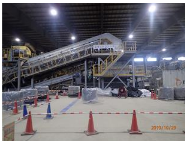
受入・分別施設における事故発生状況の確認