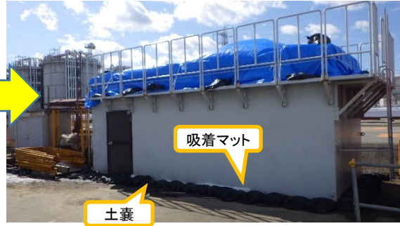
(写真1-2) 資材倉庫の外観 (本日(3月11日)撮影)