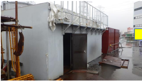
(写真1-1) 資材倉庫の外観 (昨日(3月10日)撮影)