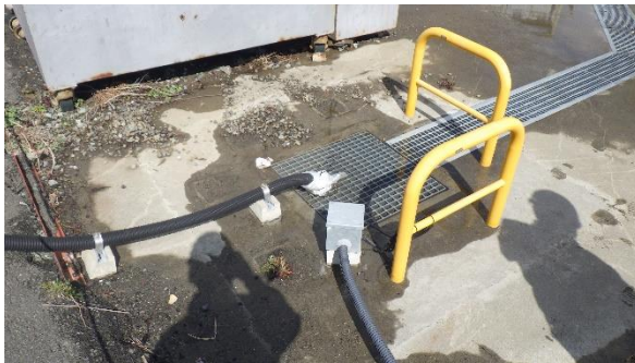
(写真2-2) 資材倉庫下流側の側溝及び集水ピットの状況 (水溜まりに油膜は見られなかった。)