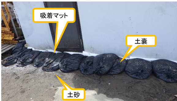
(写真2-1) 資材倉庫周囲の状況 (油流出の形跡は見られなかった。)