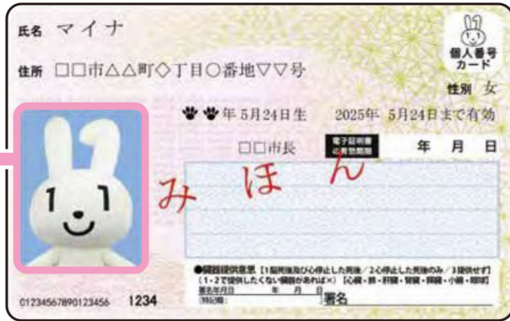
< おもて面 >