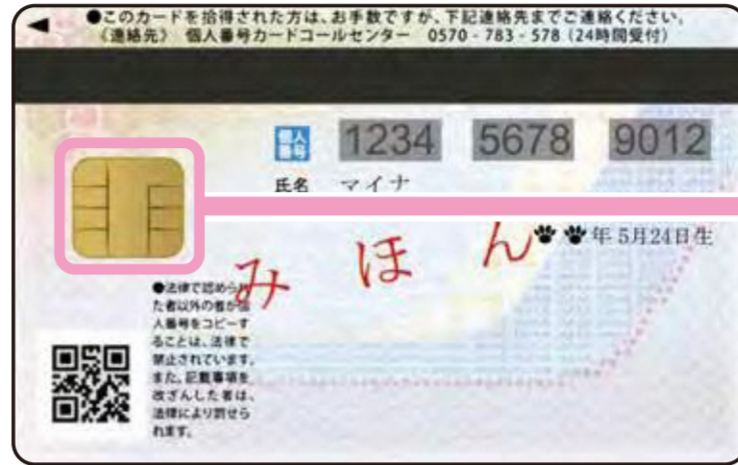
< うら面 >

うら面のICチップにあなた本人であることを証明する、「 電子証明書 」が入っているよ!