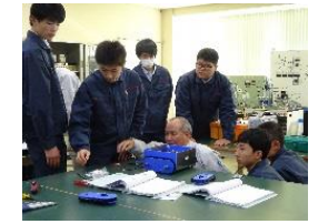
小高産業技術高校×会津大学