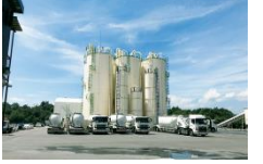
福島エコクリート(株) (H30.3操業開始)