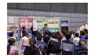
ふるさと創造学サミット (双葉郡8町村の小中学校等)