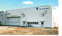
フォーアールエナジー(株) (H30.3操業開始)