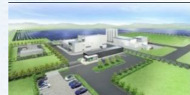
※東芝エネルギーシステムズ(株)資料