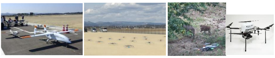
福島ロボットテストフィールドでのドローン実証