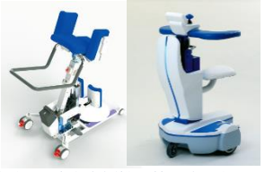
移動介助・移動支援機器等の実用化開発 (株)アイザック