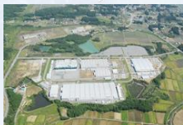
IHI工場 (相馬市)