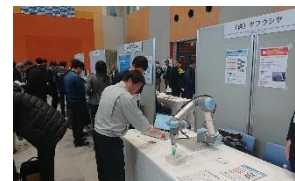
ふくしまみらいビジネス交流会