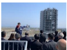
オーダーメイドツアー