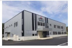
(株)リセラ (H29.12操業開始)