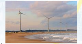
万葉の里風力発電所 (南相馬市)