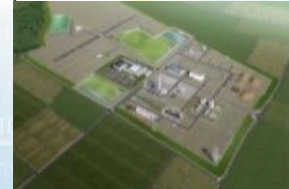
福島ロボットテストフィールド