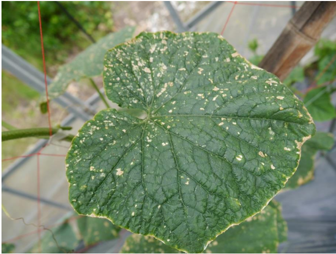
写真 1 : 罹病葉