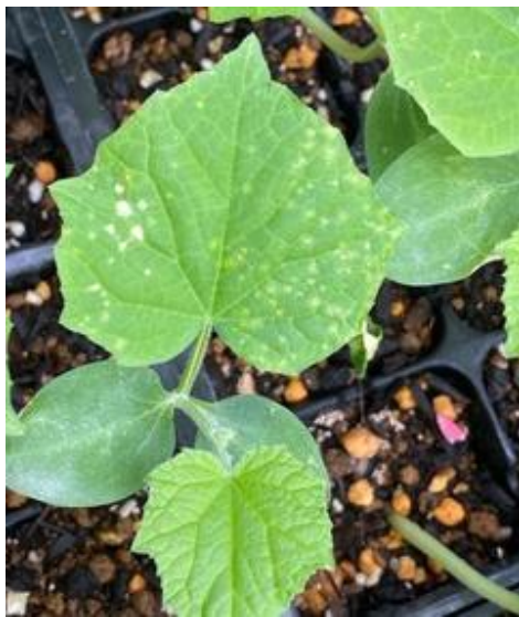
写真 3 : 接種試験によるキュウリ幼苗での症状