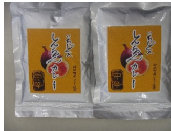
しんちゃんカレー