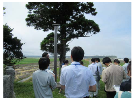
農村整備部の事業説明 (総務部)