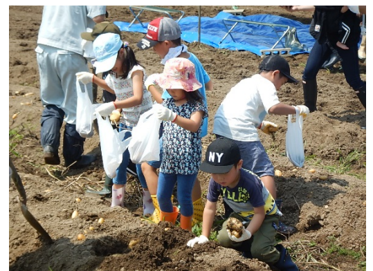
じゃがいもの収穫