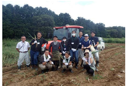
令和元年9月1日ねぎほ場での作業体験 （南相馬市）