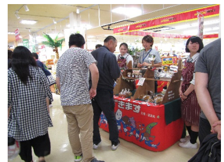
第1回 相馬農業高等学校