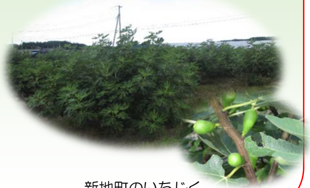
新地町のいちじく