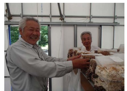
菌床キクラゲ収穫