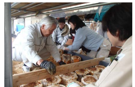
原木マイタケ伏せ込み

相双地方の野生キノコは引き続き出荷が制限されておりますので、秋の味覚は安全が確認された栽培キノコを楽しまれてはいかがでしょうか。