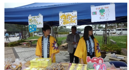
第2回 小高産業技術高等学校