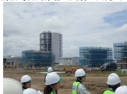
(農村整備部) 福島ロボットテストフィールドのパトロール状況