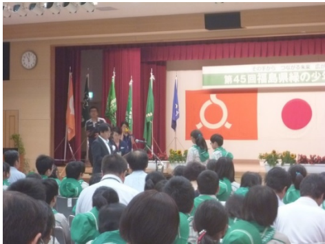
相馬市立山上小学校緑の少年団の表彰

当所では、今後とも、森林への親しみと学習を通じ、緑の少年団の活動への支援を行ってまいります。