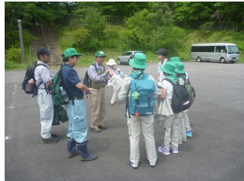
大甕緑の少年団自然観察 (森林林業部)