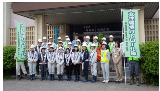
南相馬合同庁舎玄関前の出発式