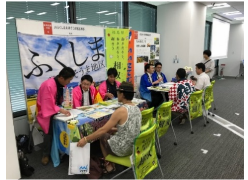
令和元年8月4日就農関係フェア（東京） （JAふくしま未来・飯舘村）

「バスツアー」は、8月31日～9月1日に第1回目を実施しました。首都圏や宮城県から7名の参加があり、参加者は、飯舘村、南相馬市、浪江町の生産者や直売所等から、農業経営に関する話を聞き、簡単な農作業を体験しました。また、同市町村から、就農に向けた支援策の紹介と、先輩就農者の講話をいただきました。参加者からは、「就農に向けた第一歩を踏み出せた」「また来てみたい」といった感想が寄せられました。第2回目は、10月末に実施の予定です。