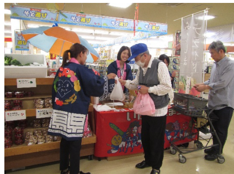
6月22日キャンペーンの抽選会 (企画部)