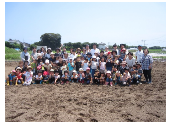
参加者全員での記念撮影