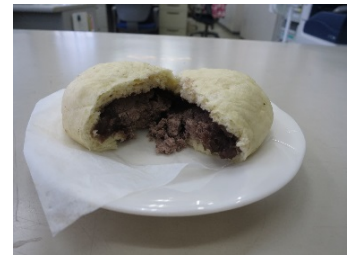
いちじくあんまん

※いちじくあんまんは平成30年度「そうそう・6次化ラボ」事業で開発した試作品を商品化したものです。