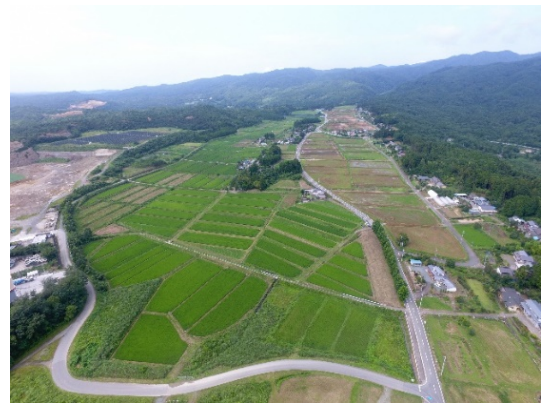
左側が稲刈後工事予定、 右側が工事中 （亀ヶ崎工区）