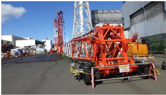
(写真1-2) 3号機原子炉建屋西側の状況 (南側から撮影)