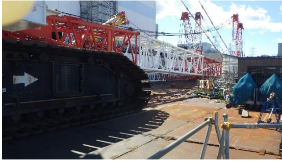
(写真1-1) 1号機タービン建屋北側の状況 (東側から撮影)