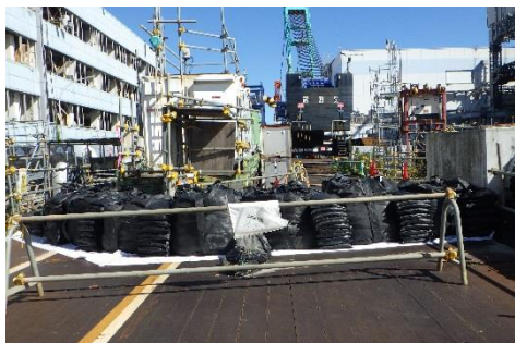
(写真2) 大熊通り下端の状況 (西側から撮影)