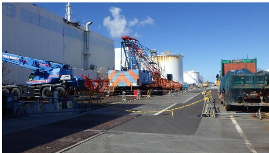
(写真1-3) 3号機タービン建屋東側の状況 (南側から撮影)