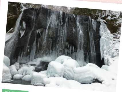
猪苗代町 達沢不動滝