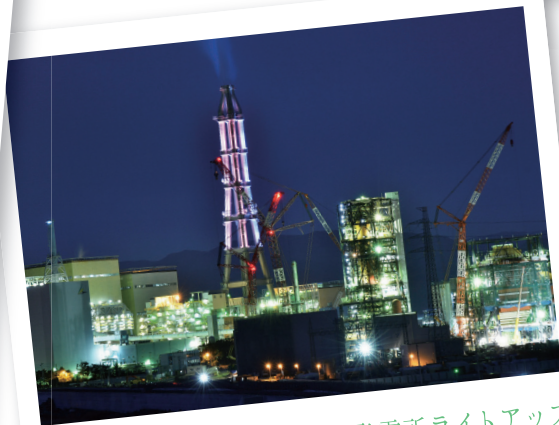
いわき市 常磐共同火力勿来発電所ライトアップ