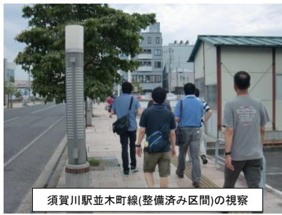
須賀川駅並木町線(整備済み区間)の視察