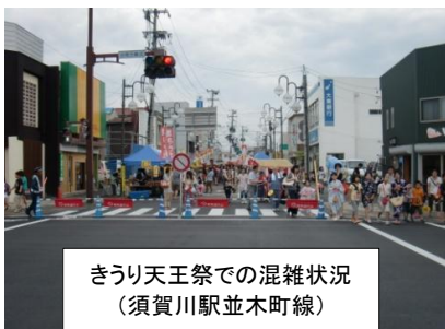
きゅうり天王祭での混雑状況 (須賀川駅並木町線)

当日は、地域の方々と現状やこれからの展望等について、広く意見交換をする事も出来ました。