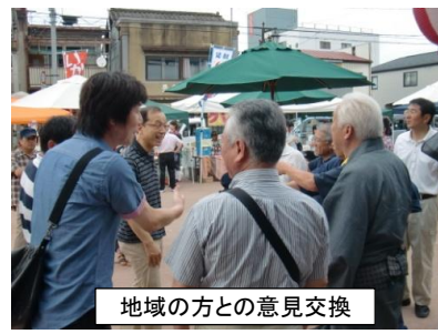
地域の方との意見交換