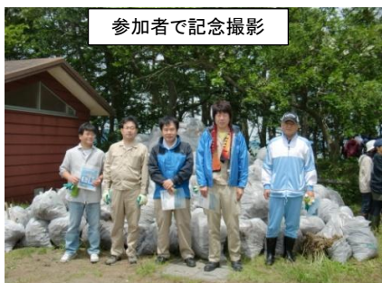
参加者で記念撮影