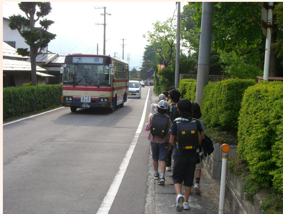
国道349号（矢祭町下関地内）