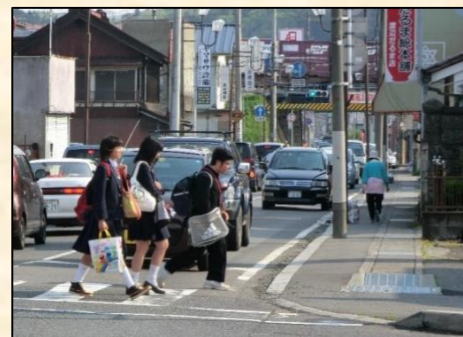
道幅が狭く歩行空間が不十分