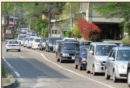
道路交通が集中し渋滞が頻発

市内での安全な通勤・通学や日常生活での利便性確保、観光客を招き入れての地域活性化、広域的で安定した物流などを実現するため、歴史ある街道筋を残しつつ新たな白河市内の骨格をなす道路として、白河市を南北に縦断する国道294号白河バイパスを平成30年代前半の供用開始を目指し整備しています。