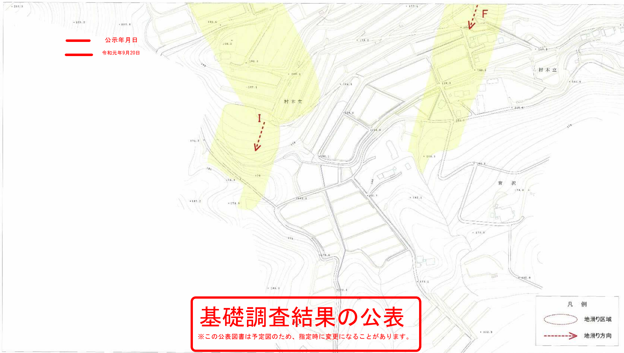
様式-2(地) 土砂災害警戒区域・土砂災害特別警戒区域 区域図