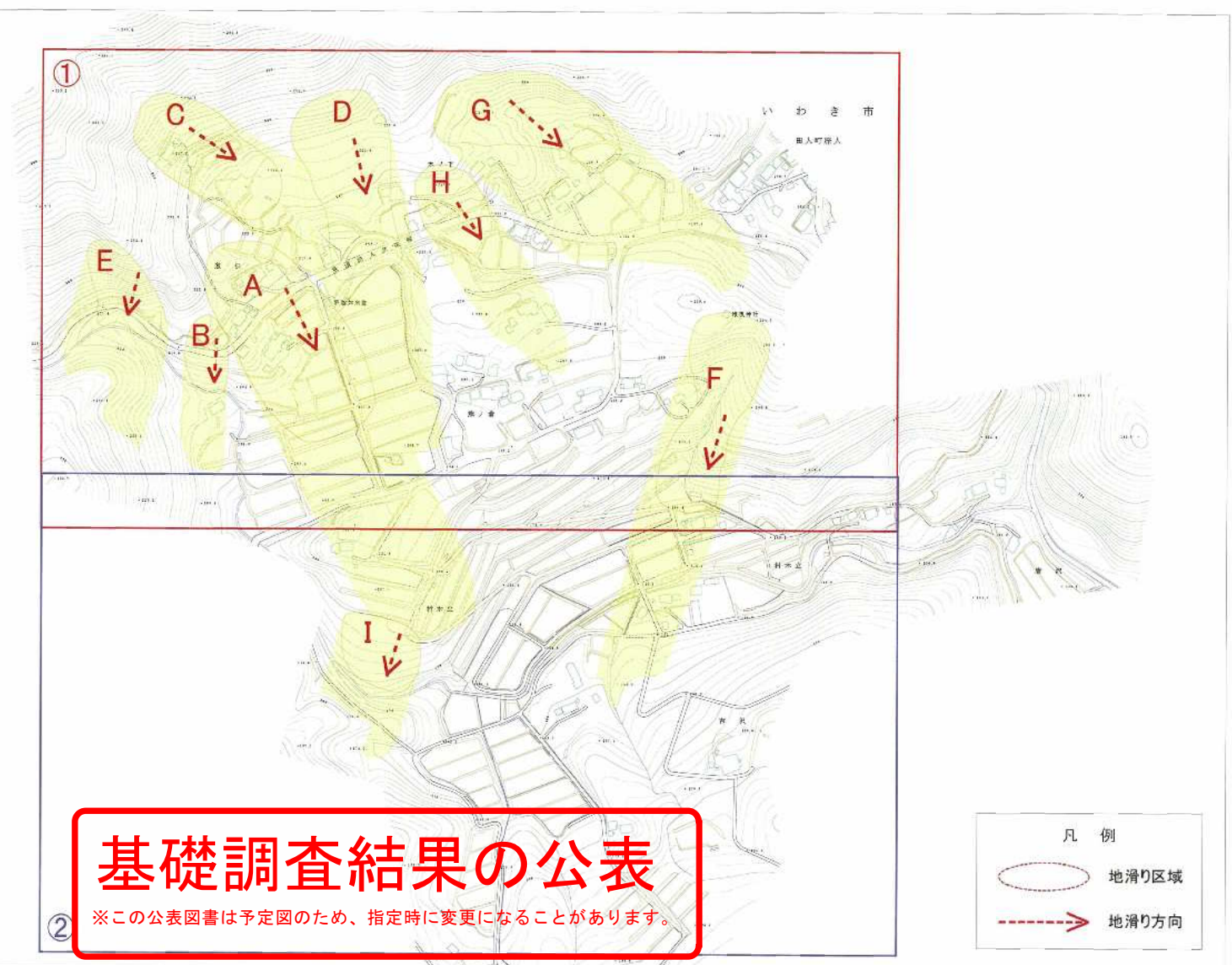
様式-2(地) 土砂災害警戒区域・土砂災害特別警戒区域 区域図