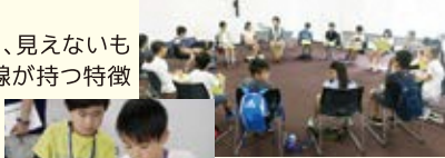
小学生のミーティング

さまざまな実験を通じて、見えないものの世界を知ること・放射線が持つ特徴を知ること・アイデアを膨らませること・再生可能エネルギーについて知ること・食の安全について知ること・食の安全について知ること・食の安全について知ること