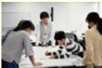
意見をまとめる中学生

物質について、放射性物質と食の関係について学ぶとともに、多角的に考える練習を行いました。