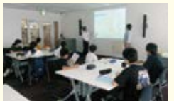
専門家による講義(中学生)

「自分で学ぶこと」について意識を高めた上で、高校生から科学の楽しみ方を教わりました。また、様々な分野の専門家のお話を伺って、放射性物質について、放射